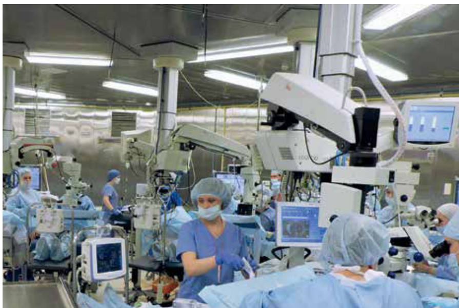
В операционном зале Центра «Микрохирургия глаза».