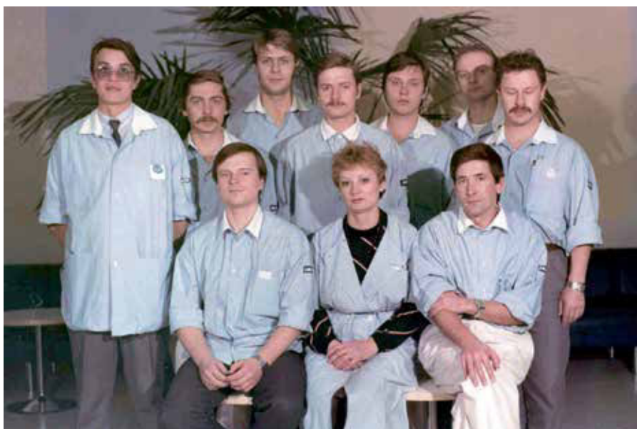
1989 год – начало работы Свердловского филиала МНТК «Микрохирургия глаза».