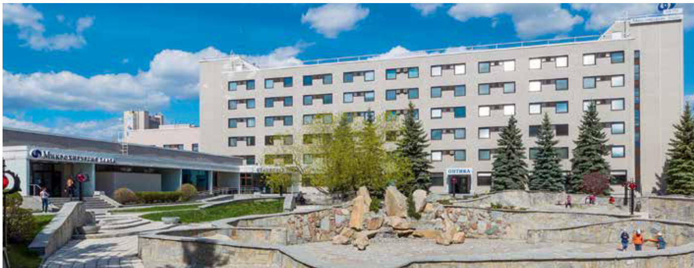
Екатеринбургский центр МНТК «Микрохирургия глаза».

разговоре. «Когда?» – спросил я. «Завтра». «Так я же еще 3 года не отработал». «Это мои проблемы». «Но завтра я получаю ключи от новой квартиры». «Нет времени».