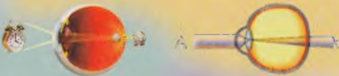
схема преломления лучей в глазу с дальнозоркостью