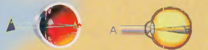
схема преломления лучей в здоровом глазу